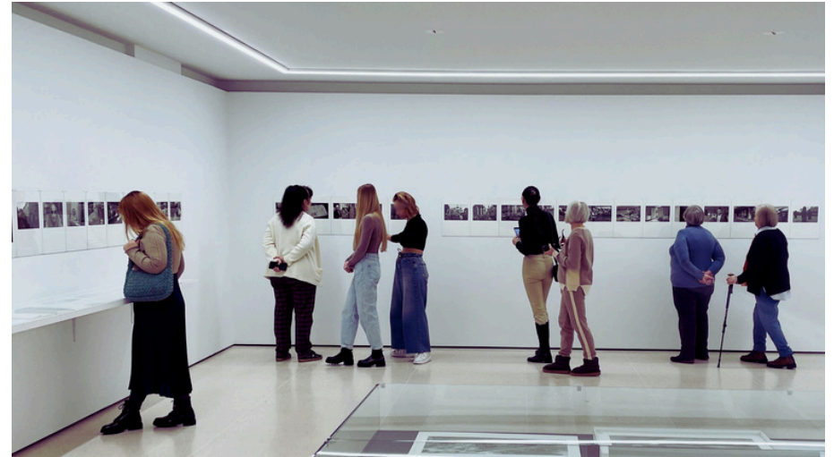
Participants examining closely the photos of Galicia region taken by Guido Baselgia in 1990s.

These workshops turned into intergenerational dialogues, fostering connections between art and personal history, and helping participants heal through shared stories.