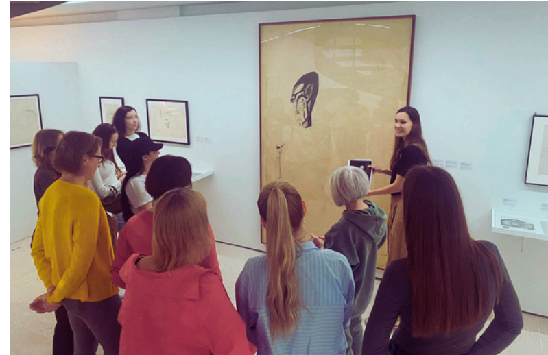
Open Project participants discovering connections in the Galaxies of Kiesler.

Frederick Kiesler's birthplace of Chernivtsi, which is now part of modern Ukraine, immediately established a deeper connection between the OPEN project participants and his legacy. This geographical tie - as well as his living through the time of two wars and moving away from his place of birth - added a personal layer to their understanding of Kiesler's artistic explorations allowing them to perceive his work not only through a global or theoretical lens but also as part of a shared cultural and historical context. This connection sparked rich discussions about the intersections of identity, memory, roots, about correlation, interconnections and finding one's own place in this Galaxy, in this Universe.